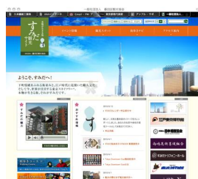
社) 墨田区観光協会 visit-sumida.jp