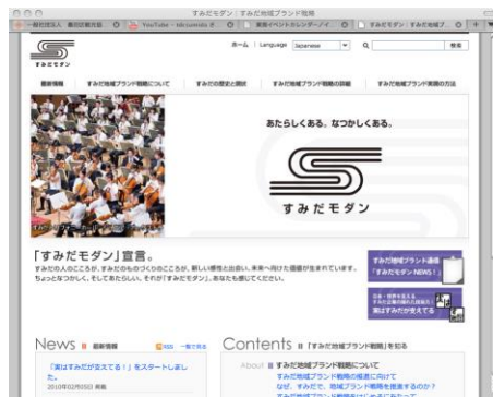
すみだモダン/地域ブランド sumida-brand.jp

地域資源をお客様も交えて発掘して活用しよう！ 街ぐるみで「全員参加」の地域活性化戦略