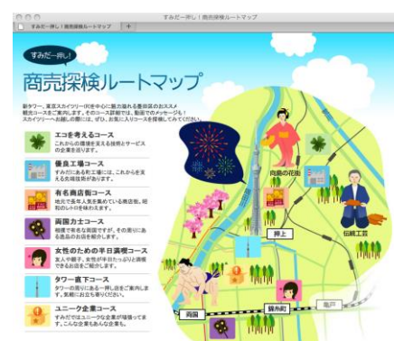
すみだ一押しBIZ MAP sumida-ichioshi.com/